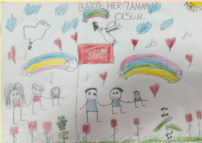
Gönül Nur ARİBOĞA