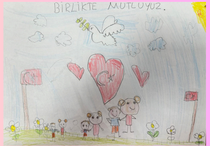
Fatime El Zehraa HİLAL